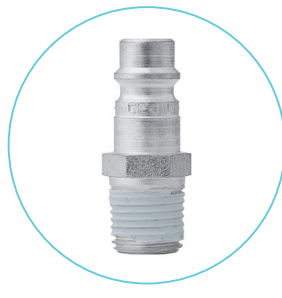
króciec NW 7,6 10 320 5152