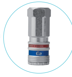
szybkozłącze bezpieczne NW 7,6 10 320 2202