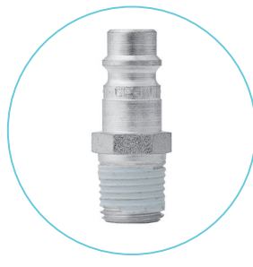
króciec NW 7,6 10 320 5152