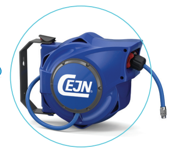
zwijacz pneumatyczny z wężem (10 m) 19 911 2022