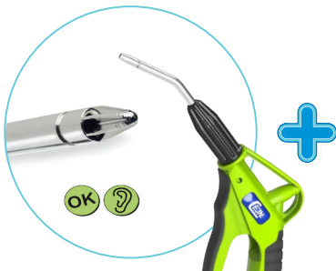
pistolet 209 11 209 3100