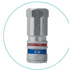
szybkozłącze bezpieczne NW 7,6 10 320 2202