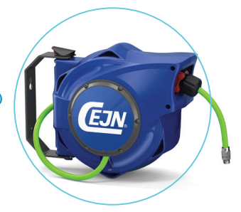
zwijacz pneumatyczny z wężem odblaskowym (10 m) 19 911 2028 z wężem odblaskowym (17 m) 19 911 2188